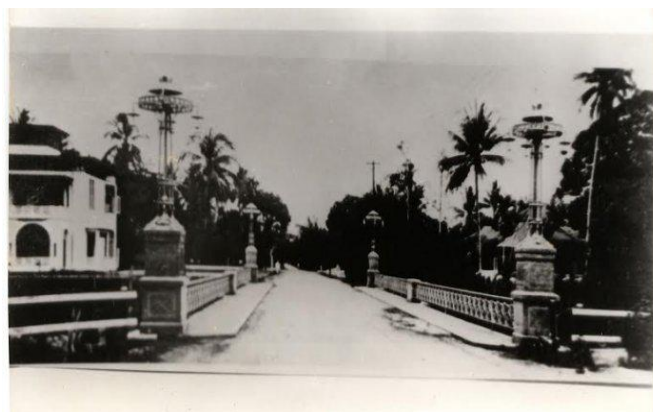
图5 善行桥

在张榕轩离世后，他的妻子命令他的儿子在棉兰市建造三座桥梁。这座桥旨在纪念张榕轩作为日里地区有影响力的人物之一。这三座桥梁中只剩下一座桥梁，直到现在仍然可以见证并被日里社会称为美德桥梁。美德桥在张榕轩离世五年后建成，就在1916年。它的存在继续坚定，直到20世纪70年代，棉兰市政府拓宽了道路。因为起初新棉兰区是荷兰种植园，称为Civev种植园，现在这片土地被用作剑桥大楼。由于坚固的桥梁支柱所以桥梁也不会折叠。然后，由苏门答腊文物局协助张榕轩后裔把美德桥梁作为遗产并在2003年获得了教科文组织的奖赏。