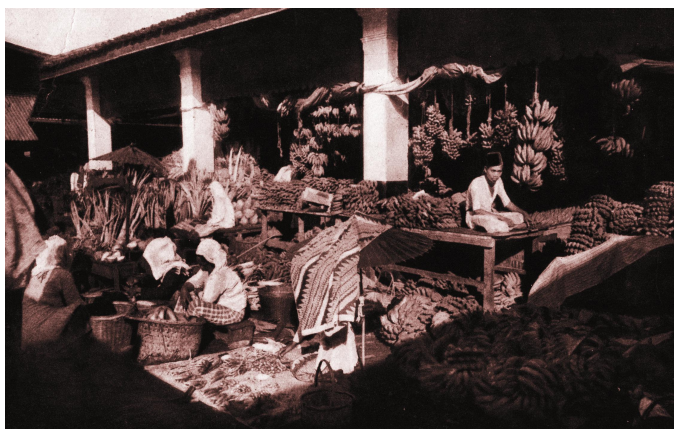
图3 棉兰市场

作为一名中国军官，张兄弟们事先知道了棉兰的规划，购买了周围的土地并建造了一排排中式和欧式风格的房屋。1886 年，他们建立了肉类市场；一年之后，1887 年，建立了一个鱼市场；1906 年建立了一个蔬年建立了一个蔬菜市场。1890 年，市场利润转向了建立 Tjie On Djie Jan 基金会，从此基金会向日里地区的中华民族 Tjie On Djie Jan 医院出资。这家医院免费收治病